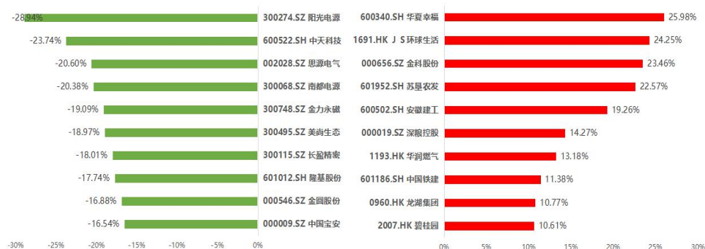
图 3 碧桂园·美好中国 ESG100 指数成分股市场表现排名（2022/03/18-2022/04/18）