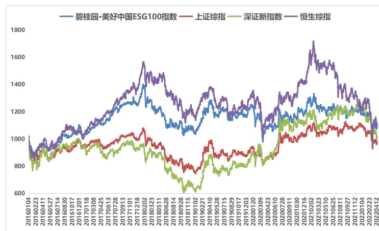
图 1 碧桂园·美好中国 ESG100 指数的历史净值（2016/1/4-2022/4/18）