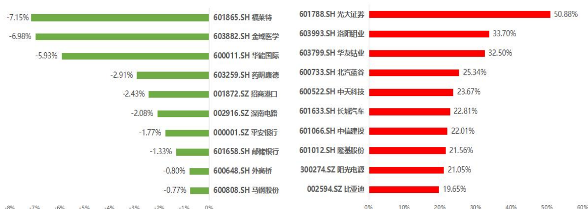
图 3 碧桂园·沪深 ESG100 优选指数成分股市场表现排名（2022/05/19-2022/06/17）